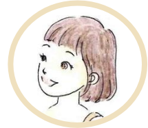
Amico/a 2 (lo studente)