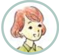
Amico/a 1 (l'insegnante)